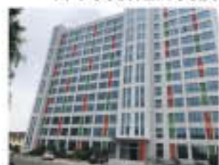
金城大厦立面效果图

2020年7月10日，无锡市梅村经济发展有限公司梅村科创中心（金城大厦）装修改造工程项目在建设单位、设计单位、监理单位以及锡山三建共四家单位的严格仔细验收下，顺利完成了竣工验收，得到了几方单位的充分认可以及高标准的评价。