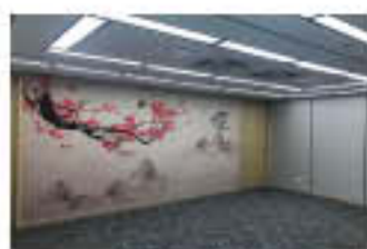
现场局部装饰效果图